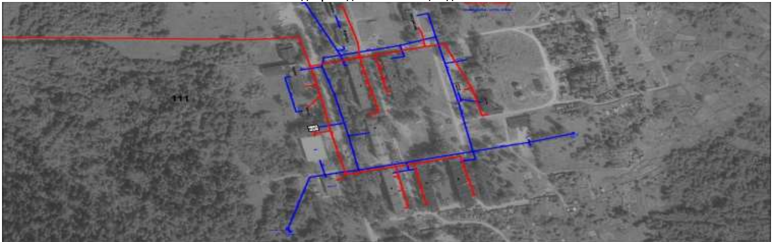
Схема водопровода и канализации д. Ивантеево

к схеме водоснабжения и водоотведения на территории Ивантеевского сельского поселения