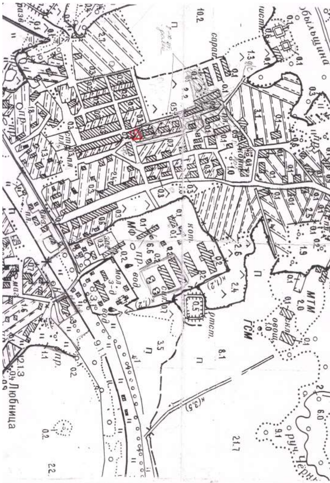
Схема расположения мест, предназначенных для формирования земельных участков, для отдельных категорий граждан, включенных в список граждан, имеющих право на бесплатное получение земельных участков, на территории Любницкого сельского поселения д. Любница, ул.Молодежная Любницкого сельского поселения Валдайского района Новгородской области

постановлением Администрации Любницкого сельского поселения от 14.02.2017 № 18